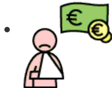
Kosten bij ziek zijn