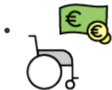
Kosten bij beperking